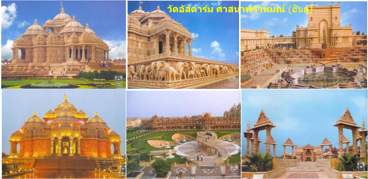
วัดอัสดารัม ศาสนาพราหมณ์ (ฮินดู)

14.00 น.-เดินทางถึงสนามบินเดลี+รับกระเป๋าสัมภาระแล้วต่อรถโค้ชปรับอากาศเดินทางสู่เมืองหลวงนิวเดลี (20 กม./ใช้เวลา 1 ชม.) 15.30 น.-ชมวัดฮินดู "AKSHADHAM" อัสดารัม (อาศรรวม) หรือ อาศรัทธา วัดฮินดูใหญ่สวยที่สุดในโลก ใจกลางนิวเดลี ยิ่งใหญ่อลังการ เล่ากันว่าเจ้าอาวาสวัดนี้บวชตั้งแต่เด็กแล้วไปบำเพ็ญเพียร ณ เทือกเขาหิมาลัย จนสำเร็จฌานพิเศษแล้วจึงมาสร้างวัดแห่งนี้ขึ้น โดยมหาเศรษฐีใจบุญมีศรัทธาอันแรงกล้าบริจาคทรัพย์สร้างมรดกกว่าห้าพันล้านรูปี นับว่าเป็นวัดฮินดูที่ยิ่งใหญ่ วิจิตรงดงามที่สุดในโลก มีบริเวณกว้างถึง 86,342 ตารางฟุต สร้างด้วยหินทรายสีชมพูแกะสลัก และปูพื้นด้วยหินอ่อนมียอดโดมเป็นหินทรายชมพูแกะสลัก ตัวโดมสูง 72 ฟุต มีเสา โดม ล้อม 1,160 ต้น รอบโดมแกะเป็นเศียรช้างจำนวน 148 เศียร ด้านในบรรจุเทพเจ้าฮินดูแกะสลักกว่า 20,000 องค์ ใช้เวลาสร้าง 5 ปี ออกแบบก่อสร้างโดยท่าน ประมุข สวามี มหาราช