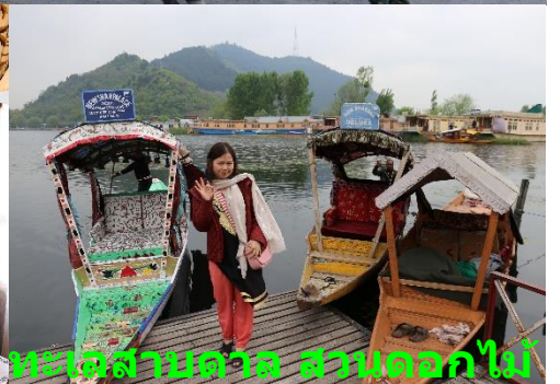
House Boat : นอนเรือน้ำ ส่องเรือซิคารา ทะเลสาบดาล สวนดอกไม้