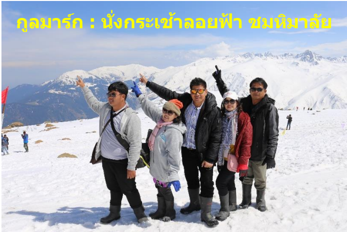
กุลมาร์ค : นั่งกระเช้าลอยฟ้า ชมทิวาลัย