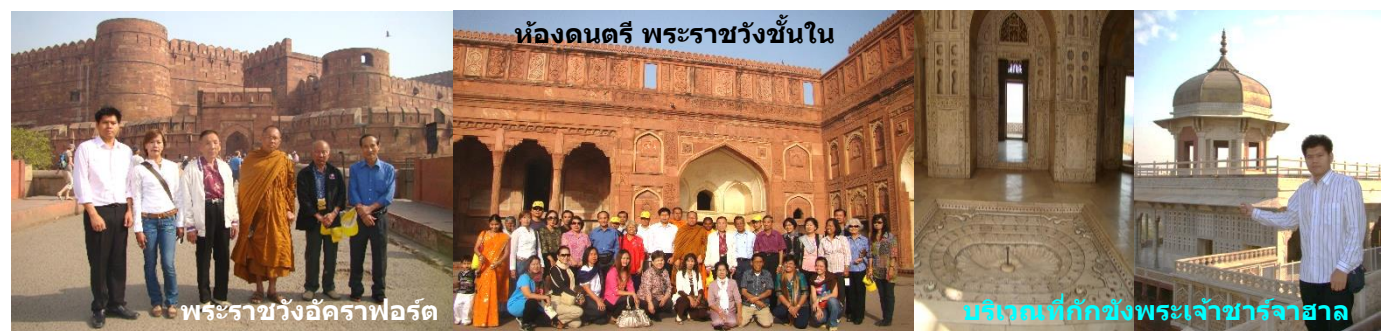
ห้องดนตรี พระราชวังชั้นใน

10.00 น. - ชม พระราชวังอัคราฟอर्ट (AGRA FORT) มีป้อมปราการสูง 20 กว่าเมตร 3 ชั้น คือ ด้านจระเข้ ด้านข้าง ด้านมนุษย์ พระเจ้าอักบารมหาราช สร้างปี ค.ศ.1565 (พ.ศ.2108) ยาวถึง 2.5 กม. แล้วเสร็จในสมัยพระเจ้าชาจาฮาล ซึ่งเจ้าชายออรังเซบ พระราชโอรสปฏิวัติแล้วให้คุมขังพระเจ้าชาจาฮาล ณ มุขแปดเหลี่ยม มีจุดชมวิวที่มองเห็นทัชมาฮาลได้อย่างชัดเจน และเป็นทีสิ้นพระชนม์ของพระเจ้าชาจาฮาล ภายในมี ห้องพระโรง-ตำหนัก-ฮาเร็มสนม 2,500 กว่าคน