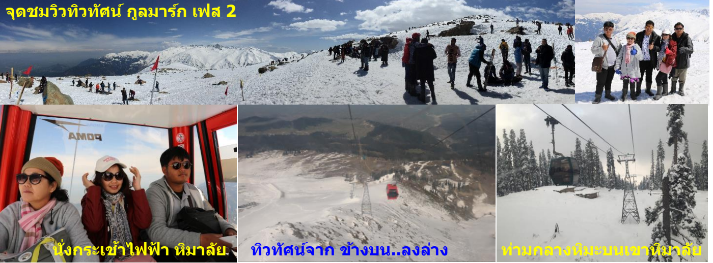
นั่งกระเช้าไฟฟ้า หิมาลัย